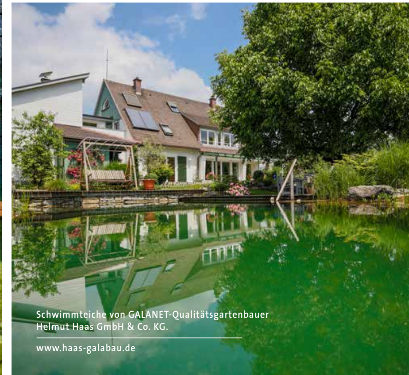
Schwimmteiche von GALANET-Qualitätsgartenbauer Helmut Haas GmbH & Co. KG. www.haas-galabau.de