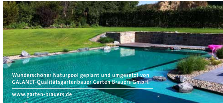
Wunderschöner Naturpool geplant und umgesetzt von GALANET-Qualitätsgartenbauer Garten Brauers GmbH. www.garten-brauers.de

Ein Naturpool benötigt im Gegensatz zum Schwimmteich keinen Regenerationsbereich mit Wasserpflanzen. Somit kann die komplette Fläche des Naturpools zum Baden genutzt werden.