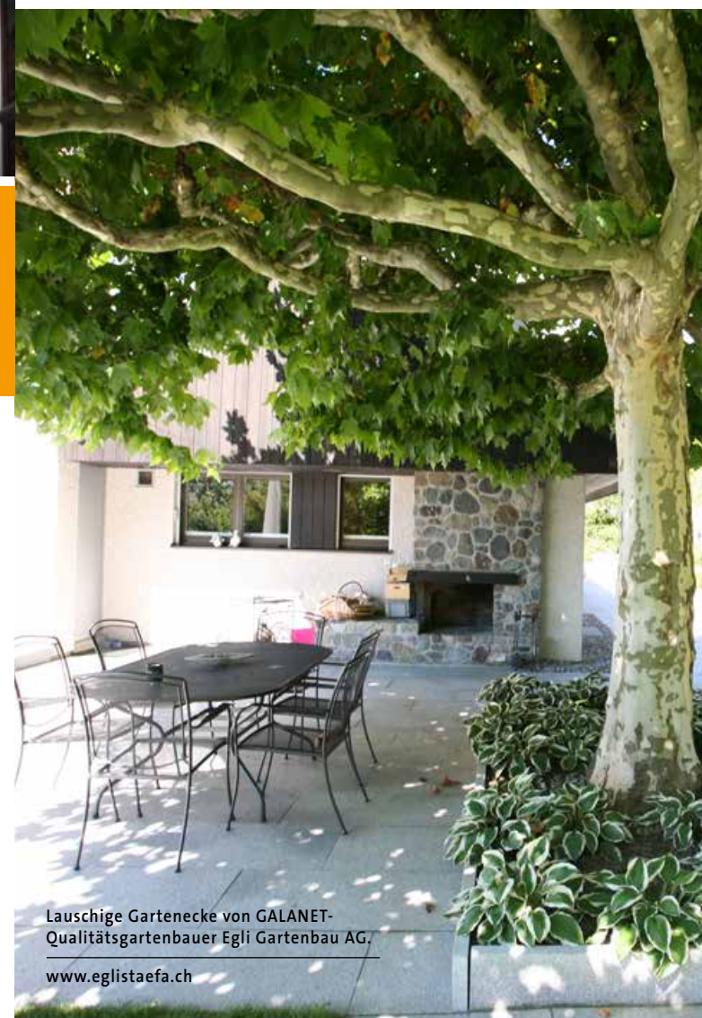
Lauschige Gartenecke von GALANET-Qualitätsgartenbauer Egli Gartenbau AG. www.eglistaefa.ch

Schatten auf ganz natürliche Art und Weise erhalten Sie in Ihrem Garten mit einem Schattenbaum. Bei genügend Platz und mit dem richtigen Baum bekommen Sie Schatten ohne hohen technischen Aufwand. Als Schattenbäume eignen sich verschiedene Gehölze. Gerade Laubbäume sind der perfekte Sonnenschirm im Sommer. Mit ihrem dichten Laub halten sie in der heißen Jahreszeit die Sonne zurück. Im Herbst und Winter, wenn wir uns nach den wenigen Sonnenstrahlen sehnen, verlieren die Bäume ihre Blätter und lassen das wenige Licht der dunklen Jahreszeit hindurch. Lassen Sie sich von Ihrem GALANET-Qualitätsgartenbauer beraten und finden Sie den richtigen Schattenbaum für Ihren Garten. Denn schon ein altes Sprichwort besagt: „Vor dem Baum, der Schatten wirft, sollte man sich verneigen.“